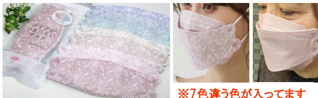
※7色違う色が入ってます

ホワイトデーや会社の異動、卒業など贈り物やお返し物 が多いこの時期、ぜひ足利屋のギフトをご利用下さい。 毎日使うものだから♪貰って嬉しい人気NO.1商品です。 レース柄も大人気！不織布3D立体マスク 無地500円 (550税込)、レース柄550円(605円税込)7枚入(各色1枚)