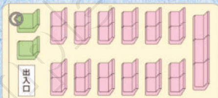
中型バス27人乗り 通行料金大型車