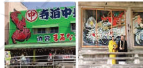
魚のアメ横 国上寺イケメン絵巻

*10・11月は1,100円増し。 *宿泊は1泊2食。夕食は貸切宴会。 *乗務員宿泊代が別途必要です。 *旅行代金は事前にお払込みです。