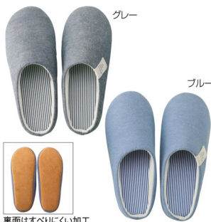
裏面はすべりにくい加工

期間中、3,000円以上お買い上げのお客様にもれなく、「爽やかデニムスリッパ」をプレゼント! 更に期間中はプリムラポイント3倍進呈いたします