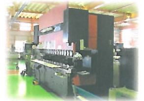
220t 4.0m プレスブレーキ