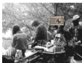
【頂上でお昼、最高です】