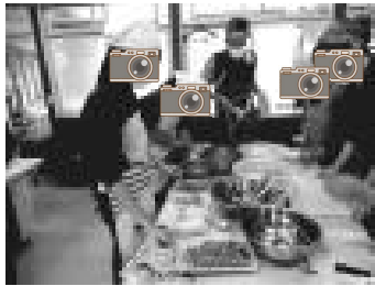
【なかなかの包丁さばき】