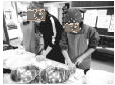
【豚汁用大根を切りまくる】