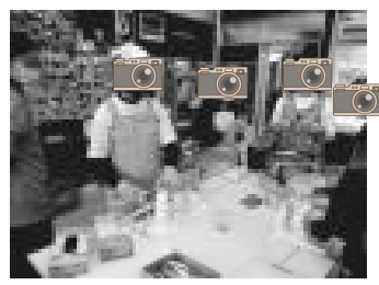
【鶏大根の大根は大きめに】