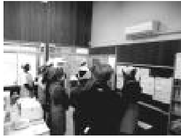
【まずは説明を聞きました】