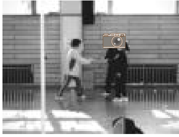
【じゃんけん競争：勝たないと前に進めな〜い】