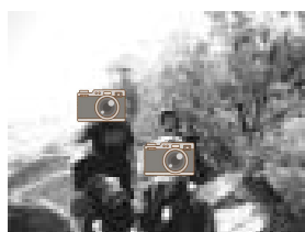
【トンビ岩で一休み】