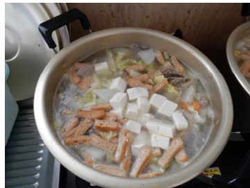
【おいしい豚汁完成！】