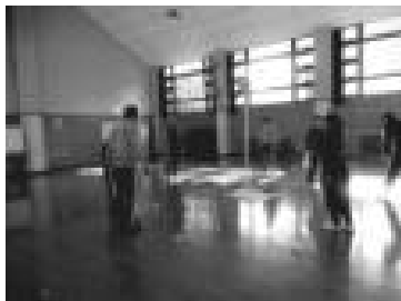
【玉入れ：職員対通室生 勝ったのは、大人げない職員】