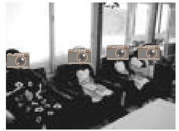
【完成まで少し休憩中】