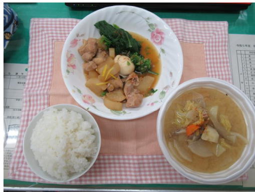
【鶏大根定食できあがり〜！ 本当においしかったです】