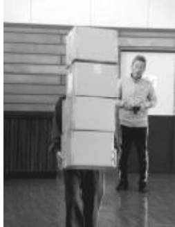
【宅配便競争：段ボールで前が見えな〜い、ゴールはどこだ〜】