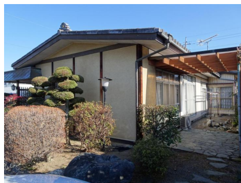
日当たり良好です。