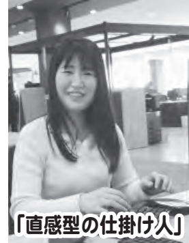
「直感型の仕掛け人」

④「看護師になろう」を、看護学生でなくても知っているサイトにしたいです。先輩方のご尽力のおかげで、開設後4年目のサイトとは思えないほど会員数・LINE友だち数がどんどん伸びてきています。私も、ページ作り・LINEメッセージ配信を介して、「看護師になろう」の発展に貢献したいです。