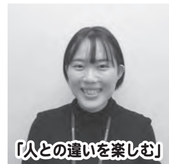
「人との違いを楽しむ」

④仕事と人格において信頼できる人になることです。そのために今できることは、業務を覚えつつ、周囲の価値観や考え方を吸収することだと考えています。人や環境にこだわらず仕事ができるようになりたいです。