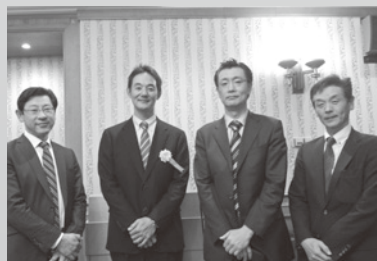
当日出席いただきましたご来賓の皆様（順不同）